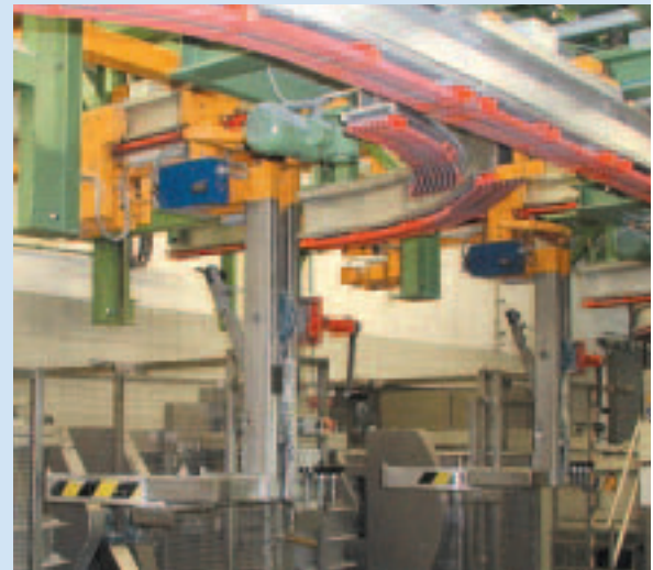
dyna-MIX avec convoyeur aérien chez VARTA pour la fabrication de piles