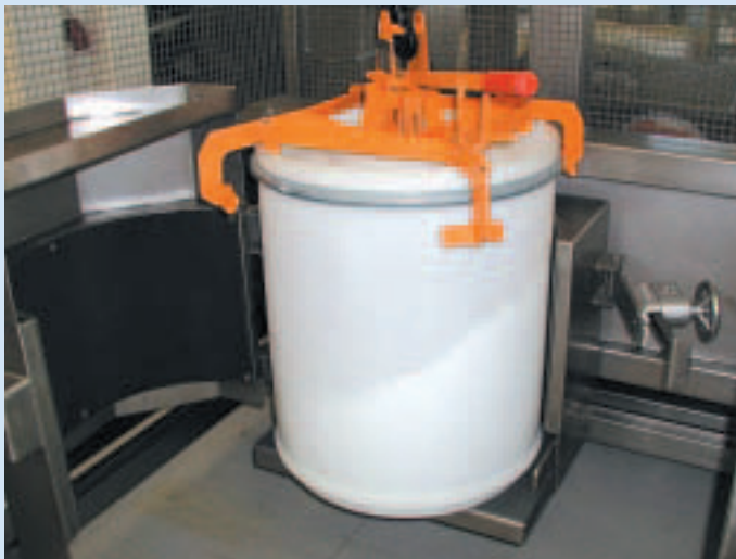
Fassgreifer für den CM 200