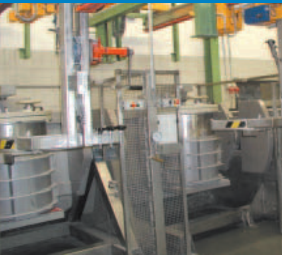
dyna-MIX mit Elektrohängebahn bei VARTA in der Batteriefertigung

En coopération avec différentes entreprises, nous possédons également un grand savoir faire en amont et en aval du procédé de mélange. N'hésitez pas à faire appel à l'expérience de nos spécialistes pour trouver une solution adéquate à votre processus de mélange.